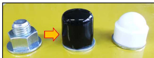
スッポリキャップ サユミノボーシ